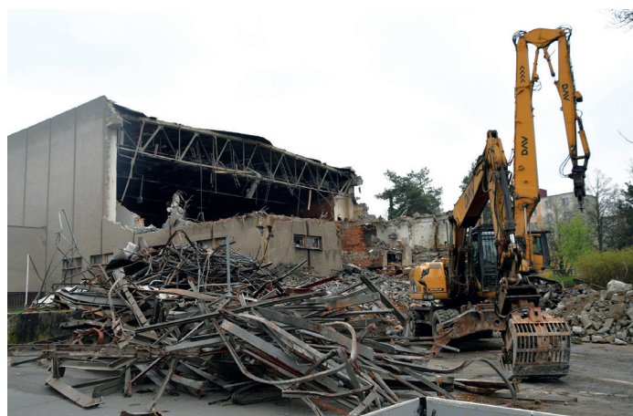
Podle primátora Korče se oproti minulosti ve městě změnilo třeba to, že za jeho vlády se nebourá.

To, že sál je nadále předurčen zejména pro větší akce, např. akademie škol,