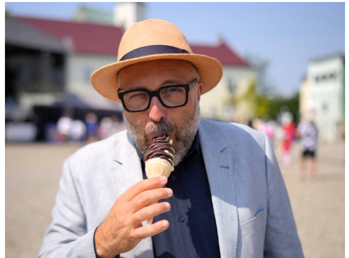
Radnice ve volebním roce vyčlenila na služby externího fotografa skandálních půl milionu korun.

Není to poprvé, co se primátor Korč chlubí cizím peřím , ostatně i se zmrzkou se například znovu i chlubí, že „jsme i v rámci republiky pozitivní výjimkou v rostoucím počtu narozených dětí“, ale to bych v kontextu tohoto lidového pořekadla nechtěl