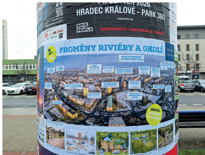
Kromě financování nesedí ani obsah. Podle nás Riviéra na svou opravdovou proměnu stále čeká.

O městském zpravodaji a fotoreportážích TV Polar nemá smysl se bavit, také jsme tyto instrumenty využívali, i když s násobně nižšími náklady, což platí i celkově o PR radnice a sebe prezentaci primátora, která personálně i finančně neskutečně nabobtnala. Vypovídá to ale o tom, že se radnice neštítí v tomto smyslu neustále posouvat limity, dokonce to vypadá, že nemá vůbec žád-