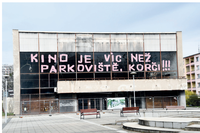
Výmluvný vzkaz, na který primátor Petr Korč reagoval výmluvami a zahájenou demolicí.

Pro připomenutí – předmětem soutěže v roce 2015 bylo nalézt optimální způsob a míru přestavby a rekonstrukce budovy kina, přičemž náklady neměly přesáhnout 200 milionů korun. Důraz byl kladen na bezbariérový pohyb po budově, uspořádání prostor pro potřeby kulturního provozu a na minimalizaci energetických nákladů na provoz budovy. Součástí byl návrh komplexního řešení parkování pro 150 aut s tím, že dočasné stání po dobu kulturních akcí mohli soutěžící navrhnout na ploše tehdejšího náměstí Evropy před kinem a na ploše stávající zeleně podél ulice Frýdlantská, včetně využití stávajícího parkoviště a suterénu budovy, přičemž měli minimalizovat zásahy