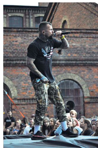
Genius loci slezanské Osmičky už prověřily i hvězdy, které si pochvalovaly jedinečnou atmosféru.

ale nabízí se spousta otázek jako dotlační ekonomika, nároková mentalita . Jde tu o střet toho soukromého světa, který je velice pohyblivý a inovativní, na rozdíl od byrokratické veřejné správy. Je přitom těžké rozlišit, co je ten svět ryze soukromý, co veřejný, co je případně ten politický a mě by osobně uklidnilo, kdyby se dalo konstatovat, že celý ten prostor a ty vyvíjené aktivity budou apolitické . Závazek, že to bude ryze nepolitická činnost, by možná přispěl k jednoznačné podpoře,” nadhodil Radovan Hořínek, bývalý náměstek primátora za ANO, který jízlivě doplnil: „Aby to nebylo, že jedna fotka na Osmičce nás vyjde na dvanáct milionů. Samozřejmě když těch fotek bude deset...”