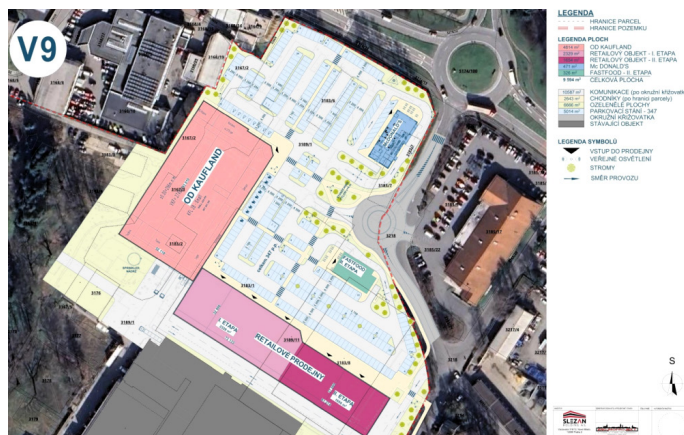
↑ Připravovaný projekt v areálu Slezanu naproti místeckému Lidlu, který se veřejnosti nejeví jako potřebný.

Za vaše vyjádření zde moc děkujeme stejně jako za nabídku a ochotu poskytovat nám informace přímo, také na nás jistě stále máte potřebné kontakty. Určitě toho využijeme. Vše, co jste napsali, chápeme, nikdo vás neosočoval z rozporů s platnou legislativou nebo me-